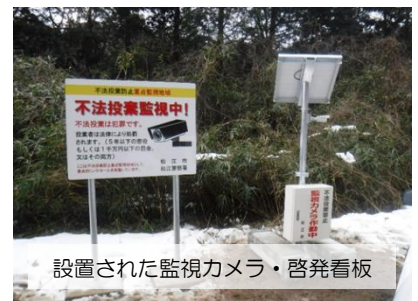
設置された監視カメラ・啓発看板