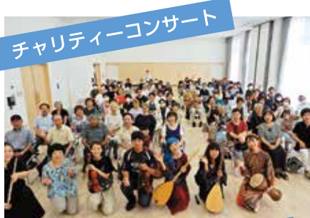
チャリティーコンサート