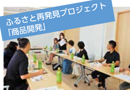
ふるさと再発見プロジェクト 「商品開発」