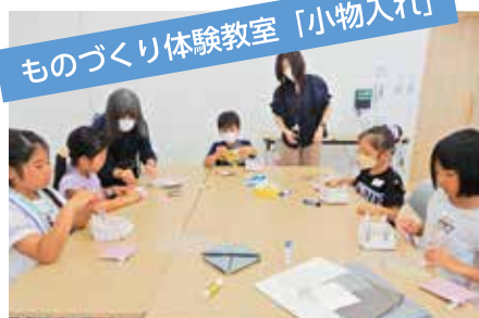
ものづくり体験教室「小物入れ」