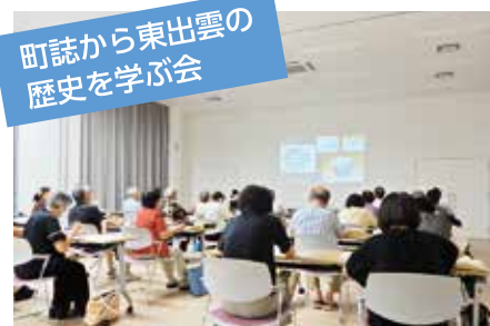
町誌から東出雲の歴史を学ぶ会