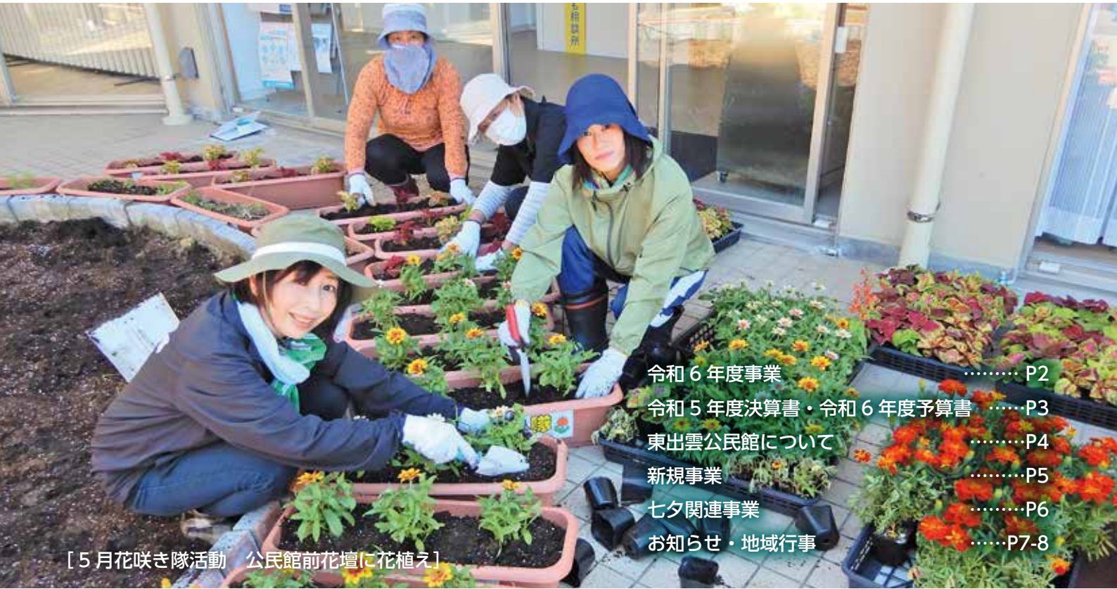
[5月花咲き隊活動 公民館前花壇に花植え]