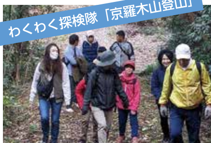
わくわく探検隊「京羅木山登山」