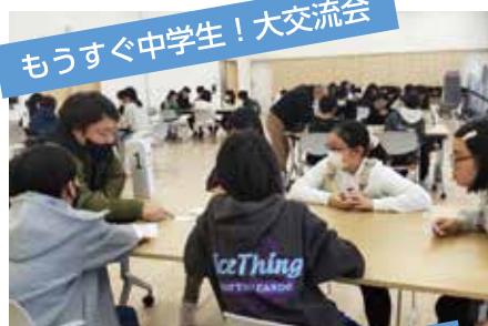
もうすぐ中学生！大交流会