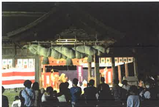
(貴船神楽社中による「大蛇(オロチ)退治」の奉納)