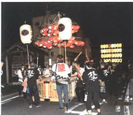
(松江藝友会が祭りを盛り上げました)