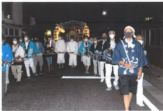
(氏子代表が神幸丸を曳いて神社へ向かいます)

神社の拝殿では、貴船神楽社中による神楽「大蛇(オロチ)退治」が午後七時三十分と午後九時三十分の二回奉納され、オロチの舞に多くの参拝客が酔いしれました。午後九時から、奉賛花火が打ち上げられました。