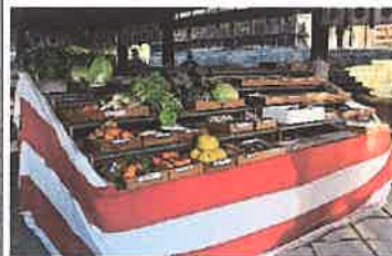
(氏子の皆様から多くの作物などが奉納されました)

令和四年十一月二十五日 に新穀をお供えし恵みに感 謝し氏子の繁栄をお祈りす る新嘗祭と、今年収穫された 品々を神様にお供えし感謝 申し上げる庭積献上祭が斎 行されました。