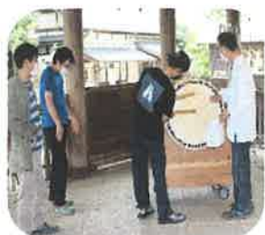
(8月20日太鼓の講習会)