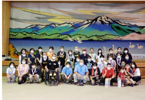
みんなで集合写真