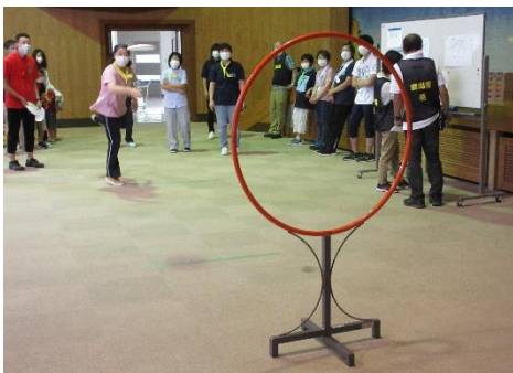
フライングディスク、枠の中を通して！

9月18日(日)、バリアフリースポーツ交流会を開催しました。だれもが心豊かにいきいきと暮らせるまちになるよう、年齢や障がいに関係なく誰でも楽しめる3つのニュースポーツを行いました。子どもから大人まで27名の参加者が6つの色に分かれて対戦し、見事黄色チームが優勝しました！初めて体験する人がほとんどのスポーツでしたが、どのチームも和気あいあいと和やかな雰囲気、盛り上がりながら楽しく交流できました。