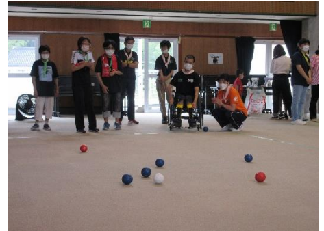
ボッチャ、的の近くヘエイ！ ビーンボウリングも盛り上がりました！